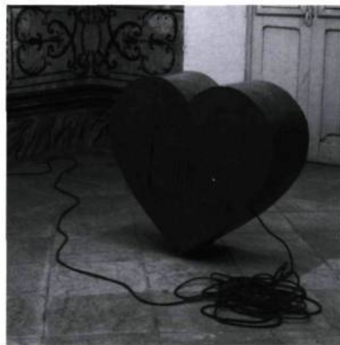
MATHIEU VALADE / ROC

En dépit de la très grande distance séparant une ville canadienne d'une ville cubaine, de la différence de langue, de systèmes politique, économique et social, et de climats opposés, des artistes des deux villes semblent avoir plusieurs choses en commun, ce qui nous amène à réfléchir sur les possibilités incroyables de l'art en tant que moyen, attitude et geste capables de mettre en relation, d'intégrer des êtres humains au-delà de leurs différences et de contribuer à une meilleure compréhension de celles-ci.